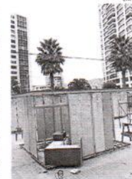
LAS OBRAS ESTÁN ATRASADAS.

Luego que este Diario diera a conocer en noviembre el lento avance de las obras y la mala calidad de lo único avanzado hasta la fecha, el módulo piloto -su principal problema fue que estaba mal hecho, pues las medidas de los paneles no calzaban y, por lo tanto, quedaba abierto, vulnerable y con mal aspecto-, se fijó una nueva fecha para entregar todo terminado, el 30 de diciembre del año pasado. Sin embargo, eso no ocurrió y el problema se arrastró hasta hace unos días,